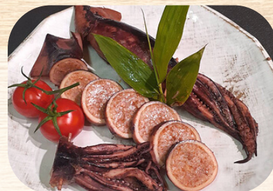
もっちりイカ飯 イタリアン