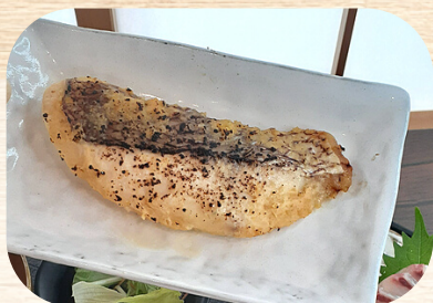
レンジdeふいっしゅ 真鯛西京漬け